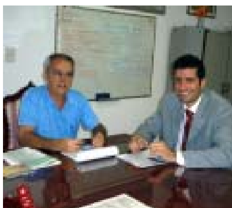
APP e Osan estudam parceria

E a APP explica: muitos associados são vinculados a