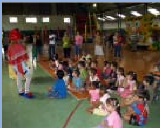
O evento já é tradição na APP

Já é tradição na APP. Todos os anos, a entidade dedica um dia para as crianças com muita festa, música, brincadeira e lanche do jeito que eles gostam. É só diversão. E você não vai deixar seu filho ou neto fora dessa, vai?