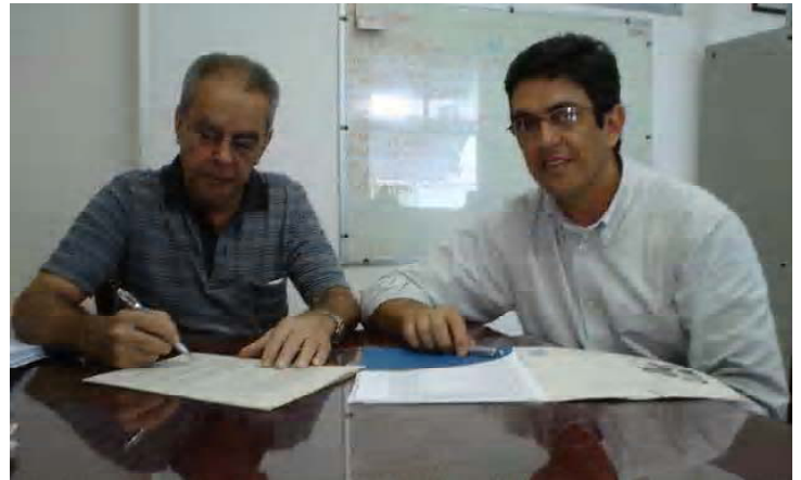
A parceria com a APO - Assistência Personalizada Odontológica, foi firmada no último mês de abril

de aparelho ortodôntico e atendimento de emergências 24 horas. Inclusive, cobertura para prótese total e removível, na contratação do super personalizado. SAIBA MAIS NA SECRETARIA DA APP SOBRE CADA PLANO E COMO ADERIR.