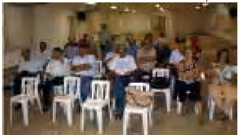
Na reunião, também foi aprovada a previsão orçamentária

Na ocasião, também foi aprovada a previsão orçamentária para o período entre 12 de junho de 2009 e 11 de junho de 2010.