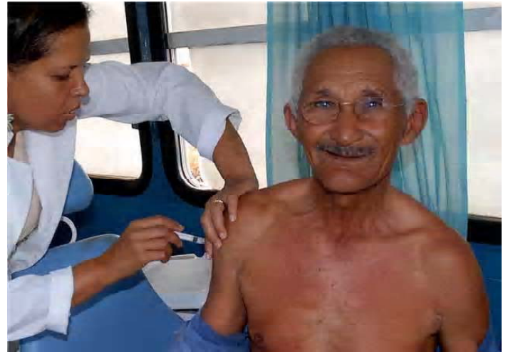
Os associados devem procurar até dia 8 de maio um dos postos de vacinação contra a gripe Influenza

pessoa já estava contaminada pelo vírus e não houve tempo da imunização agir no organismo. Algumas pessoas podem apresentar apenas dor leve e pequena vermelhidão no local da aplicação, sendo muito raro ocorrer febre e mal-estar. Quem já teve reação alérgica à dose anterior ou é portadora de doenças neurológicas em fase aguda não pode ser vacinada.